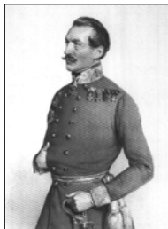
Görgei Artúr, Knézic Károly és Leiningen - Westenburg Károly